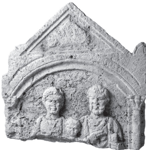
1. kép: A szőnyi sírkőtöredék Rómer Flóris jegyzetfüzetében (1859) és fotón (2006)